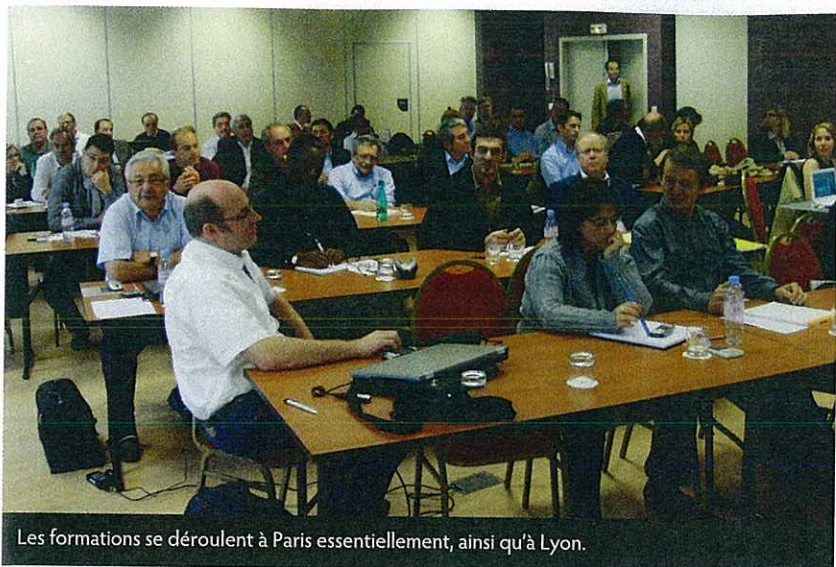
Les formations se déroulent à Paris essentiellement, ainsi qu'à Lyon.

» s'agit d'effectuer des arbitrages entre patrimoine professionnel et patrimoine privé. « Si nous nous occupons à 100 % des interactions entre le patrimoine privé et le patrimoine professionnel, nous avons déjà plus que rempli notre rôle », poursuit-il.